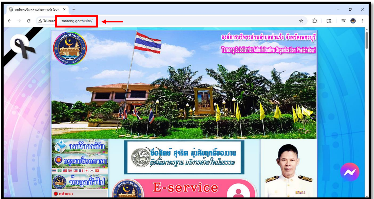
ภาพที่ 1 พิมพ์ URL